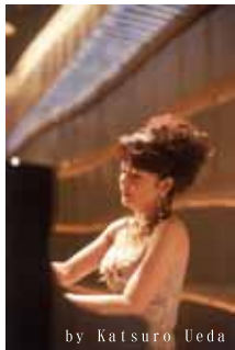
by Katsuro Ueda

仲道郁代オフィシャル・ホームページ http://www.ikuyo-nakamichi.com