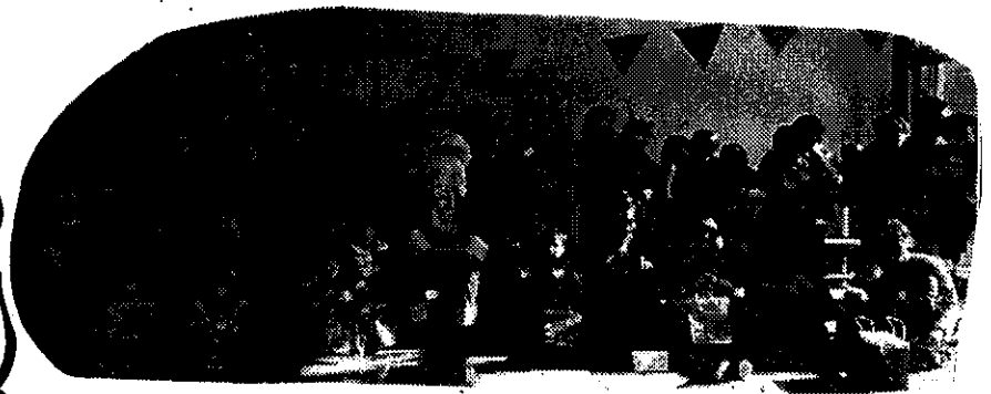
→ サンタさんを囲んで記念写真!!

サンタさんがやってきて、ママと子ども達に、プレゼントと美に夢と笑顔と届けてくれました。ありがとうございます♡