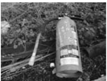
不法に投棄されている消火器