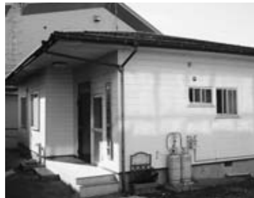
手狭になって一日も早い改築が待たれる

問 汐見台南2丁目等の住宅整備が進んで、松ヶ浜小学校の児童数も増加傾向にあり、まつかぜ留守家庭児童保育館を利用する児童も定数を上回る状況である。保護者からは「児童が増えて学年制限されるのでは」「施設が狭く何とかならないか」などの心配や要望が聞かれる。厚労省のガイドラインに照らして施設の増築など早急な改善が必要である。年度当初と現在の利用児童数は