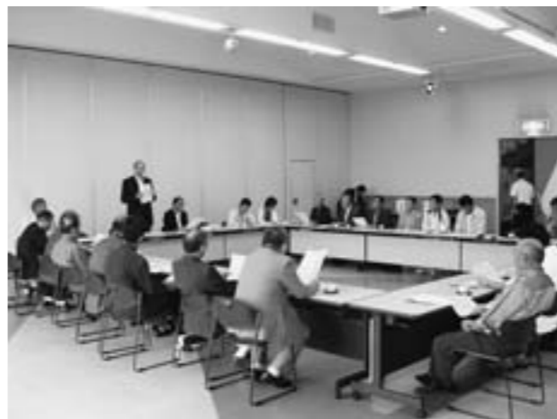
庄内町の視察研修（職工組合）

答 内装・外装などさまざまな業種とタイアップして、耐震診断等も含めた総合的な提案を町民にPRすることも必要である。今年には地域活性化・経済危機対策臨時交付金事業で公共事業の修繕等は可能な限り職工組合や関連業者に発注している