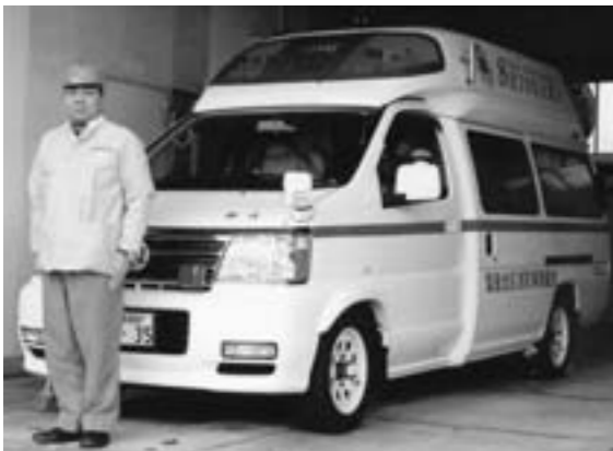
ワクチン接種も済み万全待機

不足した授業時間は学校・学級にはらつきがある。多い学級は23時間だが冬休みで回復したい