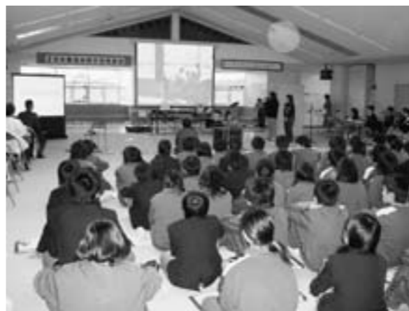
学力向上と体験学習の両立を

11月4日に教育委員会から全国学力・学習状況調査(全国学力テスト)結果の説明を受けました。本町の参加状況は3小学校の6年生203名、2中学校の3年生241名でした。学力の状況は小学生では算数の基本知識は県平均を上回りましたが、他は下回る結果であり、昨年と比較すると平均正答率は向上しました。中学生は平均正答率は向上しましたが、県及び全国平均を下回る結果でした。