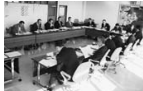
川島町議会との意見交換

先進地視察先として訪問を受けるがわけではありませんが、それぞれの研修で活発な質疑応答や意見交換をすることができ、本委員会にとっても今後の活動の参考になる意義ある研修会になりました。