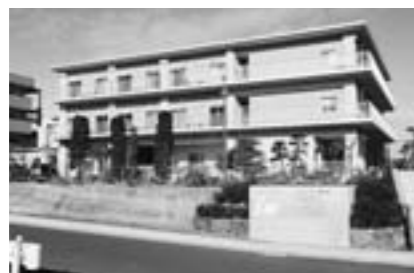
誘致予定の同規模施設（ウイズ月見ヶ丘・塩釜市）

答 県内117施設のうち自治体運営は2カ所だけであり、本町も民設民営方式と考えている