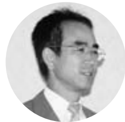
歌川 渡 議員