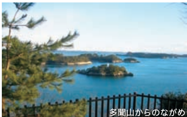
多間山からのながめ

私の町のお気に入りは、多間山の毘沙門堂の裏から眺める景色です。道中も整備され四季折々の花が咲き、それも楽しみのひとつです。他は国際村です。建物のユニークな形もですが、中庭の風情等癒される空間です。ただ国際村の催しカレンダーがあったら、小さなイベントやコンサート等にもっと出掛けられるのにと、残念に思うことがあります。是非一考を！