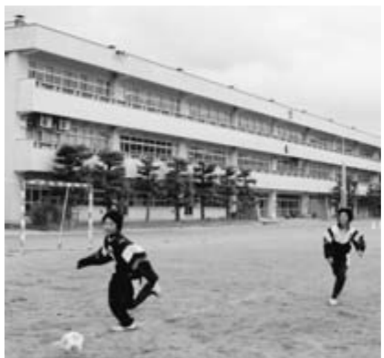
安全な校舎でのびのびと

答 8月頃に不具合となり、修繕できないがまた部品調達の問い合わせなどで時間を要した