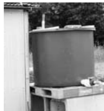
空からの贈り物を有効に

問 地区単位での開催が難しく国際村が会場となるのであれば、町がしっかりとした送迎体制を整えるべきではないか 答 近隣の市町の中でもきわめて面積の狭い本町である。家族、地域住民、ボランティアの協力をお願いしたい