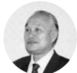
鈴木 勝美 議員