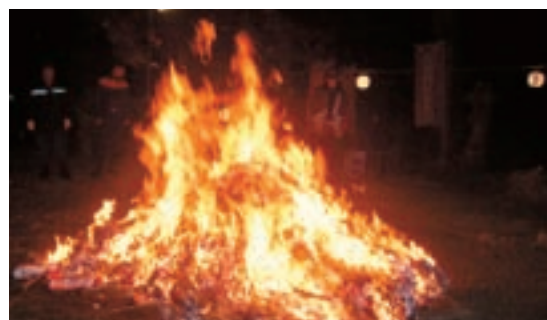
吉田神社のどんと祭（1月7日）

七ヶ浜町では各地区の神社や町内会を中心に毎年盛大にどんと祭が行われています。本年も1月9日に汐見台地区で行われ、お酒やおでんなどを売る出店もあり大勢の参拝客でにぎわいました。