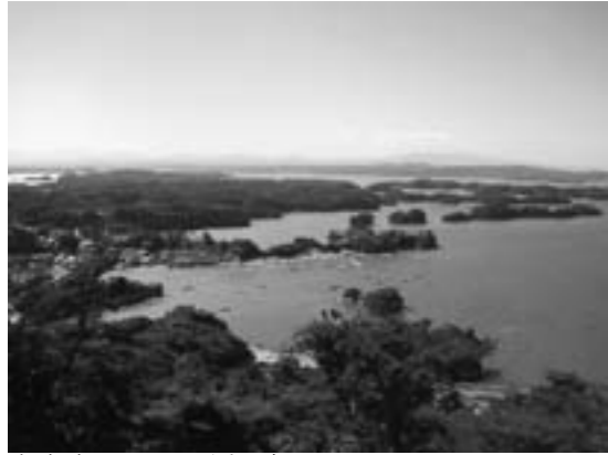
大高森から七ヶ浜を望む

一方、調査事項である七ヶ浜町を含む観光ルートづくりは、近隣自治体ならびに関係団体との協力が必要であることから、具体的な取組みを行っている自治体の現況調査から始めることにしました。