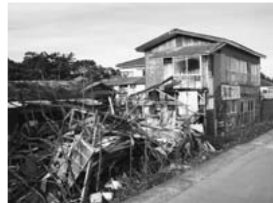
早い解決が望まれる

問 葛浦田浜長砂に長年放置されている廃屋がある。景観を損ねているとともに近隣住民に不安を与えている。町はどのように対応しているか 答 町長 一部は国有地にある建物のため、以前から東北財務局に対し環境整備の要請を再三行っていた。それによると建物撤去は所有者の責任で実施するよう指導しているが今後も継続して指導すること。他の地番は民有地であるため介入することはできない