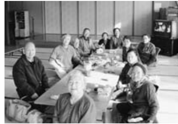
敬老の集いを身近な場所で

問 本町では75歳以上の方を対象に毎年敬老会が開催されている。現在国際村ホールで行っているが、七ヶ浜町は狭いといえども中心部1カ所に集まることは高齢者にとって負担が大きい。移動手段がなく参加できないという人もいる。該当者に対し出席者が少ないがここ数年の出席率はどうのような状況にあるのか