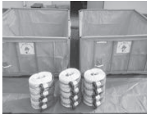
組立式水槽と消防用ホース