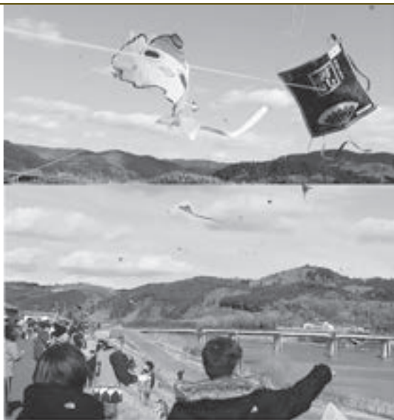
※写真はイメージ(2月4日に登米市で開催された「とよま凧あげ大会」の様子)