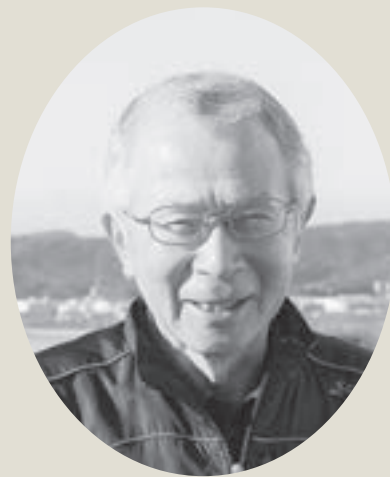
汐見台6丁目お茶のみっこ会代表 汐見台区長