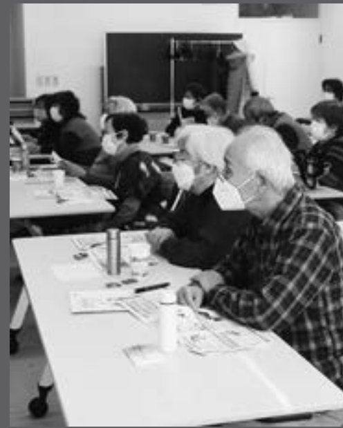
お品書き4番「縄文プレートづくり」(左)と2月13日の12番「認知症サポーター養成講座」(右)の様子