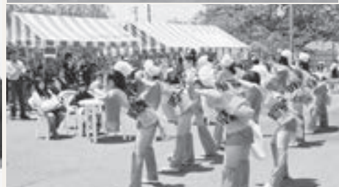
村田さん（左）、寺澤町長へ町内3小学校へのオリジナル非常用リュックを贈呈する村田さんとORI☆姫隊（右上）、七ヶ浜の仮設店舗の応援シーン（右下）

ました。避難所で歌うとおじいちゃん、おばあちゃんが笑顔になる。泣いて喜んでくれるというのがあるから今まで続けられたと思います。歌と踊りは人の心、国境をも越えていきます。