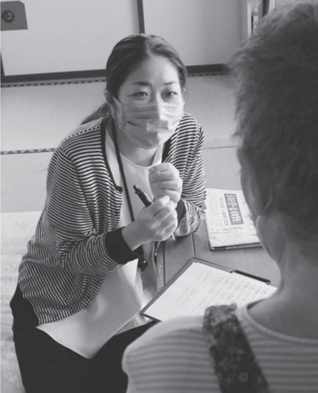
見守り支援員による訪問の様子

地震、津波、台風、豪雨……。近年、全国各地で自然災害が多発し、私たちの不安は募るばかりです。「日常を安全で安心して暮らす」。東日本大震災を経験した私たちにとって切なる願いでもあります。