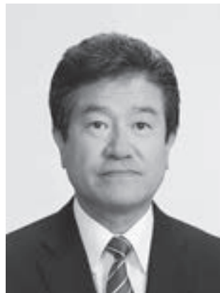
町長 寺澤 薫

令和6年度の一般会計予算額は、昨年度とほぼ同額の72億300万円となりました。今年度は、これまでの6つの政策軸をより推進し、特に「地域力の構築」、「交通対策」、「地場産業への新たな挑戦」を一体的に取り組み、まちの魅力の再発見と創出につなげる部署として、まちづくり振興課を新設しました。 6つの政策軸をさらに連動させ、引き続き「心かよう健康のまちづくり」に取り組みます。