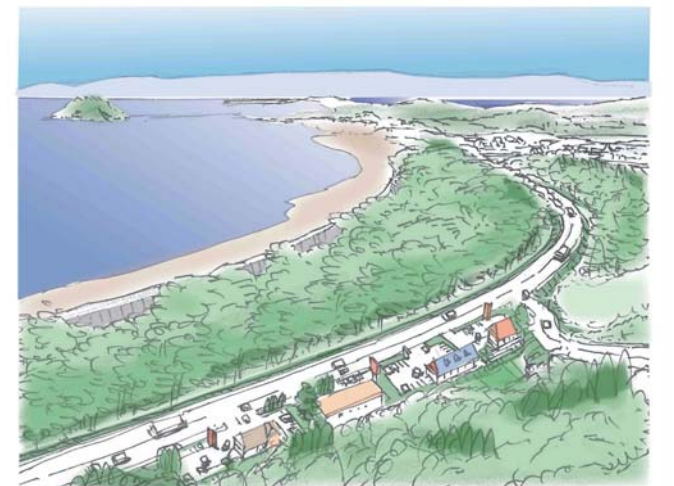
花洲浜笹山から菖蒲田海岸を望む