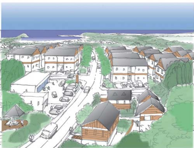
松ヶ浜西原地区から太平洋を望む