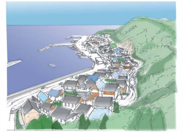
表松島を形成する代ヶ崎浜地区