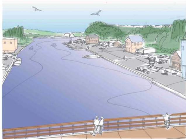
遠山地区の貞山運河沿い