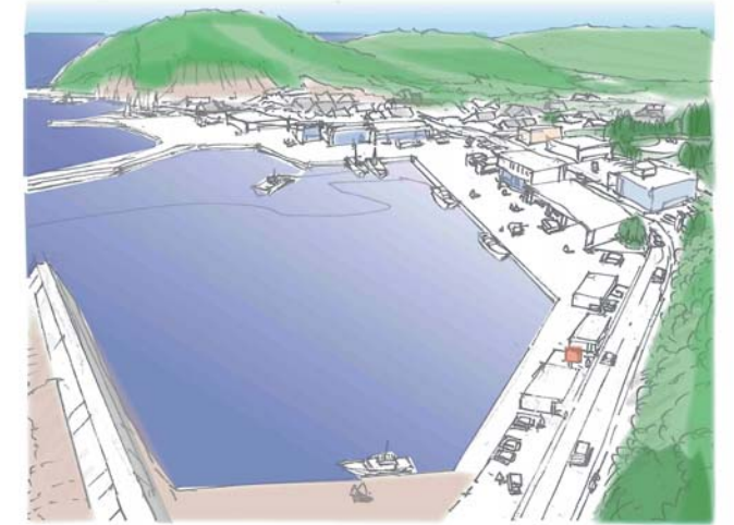
花洲小浜港・吉田花洲港