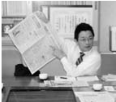
プロの記者から学ぶ

議会だよりの発行は読みやすく、分かりやすい紙面づくりを目指していますが、広報コンクールで高い評価をいただき今年も多くの市や町から視察がありました。受け入れには委員全員が参加し意見交換などでは自分たちも勉強の場と心掛けるよう努めています。さらに親しまれる議会だより