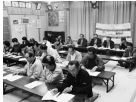
先進地の議会報告会を視察

班編成及び構成、開催回数など慎重に協議、検討を重ね素案づくりに取り組んでいるところです。