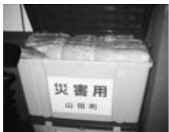
山田町の防災毛布

住民の防災への意識が高く、先人たちはその被害を最小限にとどめようとする努力を重ねてきたことがうかがうことができませんでした。また、高齢化などにより消防団員の確保も難しい今、若い世代の町職員が自主的に地域の消防団に入団する傾向があり、一人一人が災害に対し、より高い防災意識を持っていることに深い感銘を受けました。今後も継続して調査します。