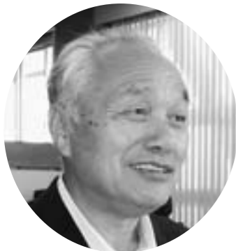
鈴木 勝美 議員