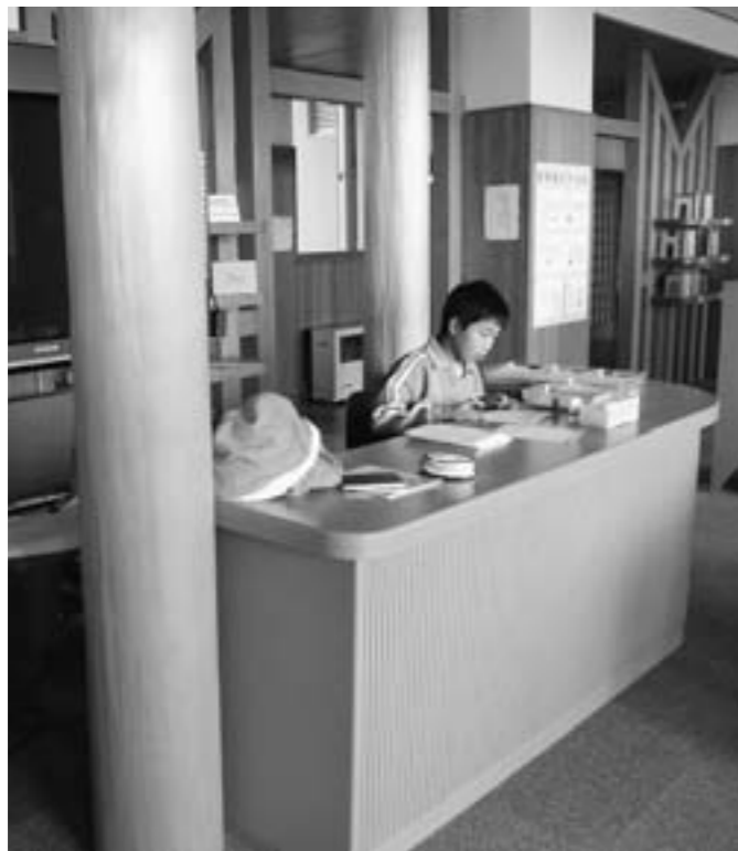
さくら小学校の校舎

40人学級から段階的に35人に移行するとの情報も入っており、国の動向にも慎重に取り組む必要があると考えている。現在空き教室は少人数指導、生徒会、会議室に使用しており、大々的にその教室を改装するとなると財源的なこともある。