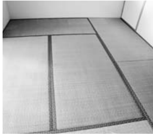
畳替えも「住宅リフォーム助成」で

問 地域経済の活性化につながる住宅リフォーム助成実施の考えは。 答 町長 今後予想される宮城県沖地震に対応した木造住宅の耐震診断・改修助成を優先したい。 問 9月県議会で「住宅リフォーム助成」に関する請願が採択されたが、今後の県の対応は。 答 町の補正に住宅リフォーム助成があれば実施の方向で検討したいとのことである。