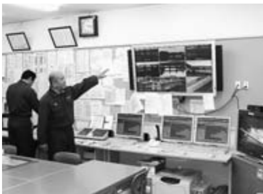
南三陸町の水門遠隔操作システム