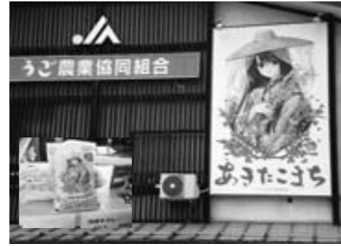
羽後町の美少女イラスト

平成22年11月に秋田県羽後町を視察しました。美少女イラストを商品のイメージキャラクターとして使用したネット販売が好調であり、うご農協が中心となり米、羽後牛カレーなど付加価値を高