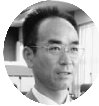
歌川 渡 議員