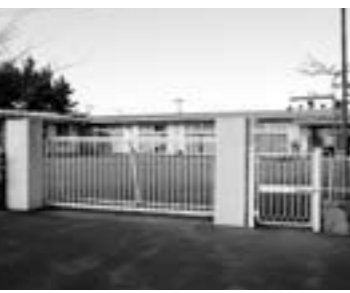
どうなるの？公的保育所の役割は

問 認定子ども園に町から支払われる保育所運営費とは。 答 国基準の保育単価から徴収した保育料を差し引いた額。 問 認定子ども園の入所認定で低所得・税滞納世帯の拒否や保育料滞納世帯の退所等は起きないか。 答 認定子ども園の入所認定で低所得・税滞納世帯の拒否や保育料滞納世帯の退所等は起きない。