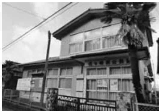
代ヶ崎浜公民分館