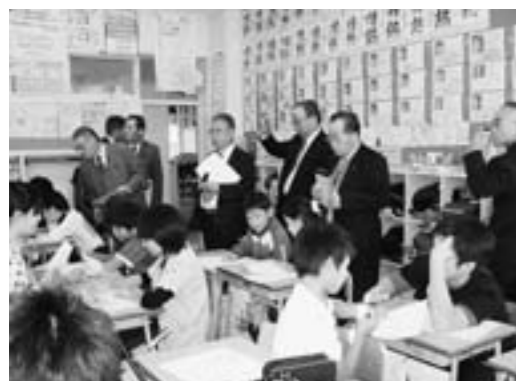
浦町小学校の授業を参観

青森市は、小・中連携の推進、教員の資質向上のための研修推進、子どもに成就感を持たせるわかる授業の実践、人間尊重と道徳教育の推進に取り組んでいます。市立浦町小学校の授業参観で、「子ども一人一人を大切にしたいやさしさと厳しさ