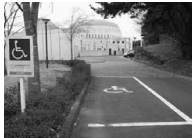
思いやり区画もあつたらいいね