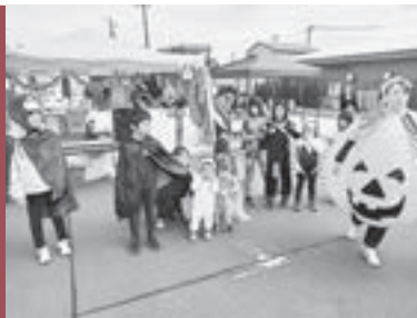
10/29の七の市でのハロウ インの仮装の様子