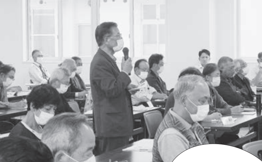
令和3年10月の地域福祉推進会議の様子

わり、みんな考えていこうと 始めました。 初めて七ヶ浜の人たちにお会 いし、私が見守りの話をした時 には、「うちではもうやってつ から」と言われ、意欲的でその 意識の高さに驚きました。七ヶ浜 の皆さんはパワフルですね。 一番印象に残っているエピソード があります。見守り活動の勉強 会で本人の同意書が必要となつた